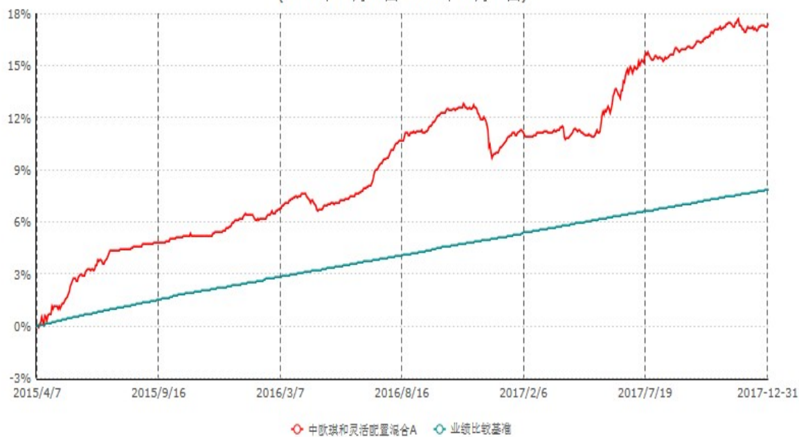
中欧琪和灵活配置混合A累计净值增长率与业绩比较基准收益率历史走势对比图 (2015年04月07日-2017年12月31日)