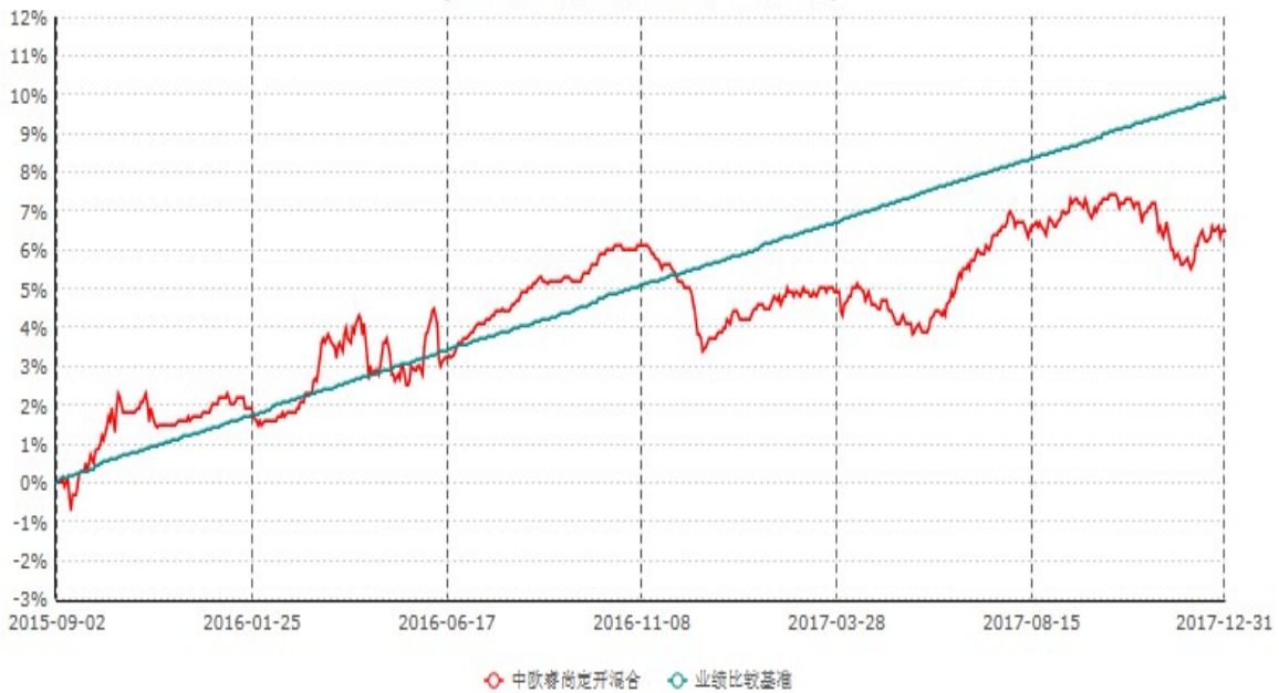
中欧睿尚定期开放混合型发起式证券投资基金累计净值增长率与业绩比较基准收益率历史走势对比图 (2015年09月02日-2017年12月31日)