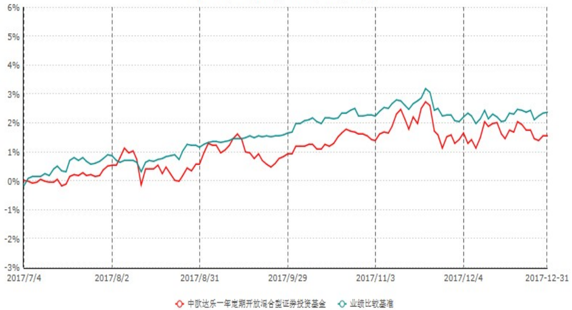
中欧达乐一年定期开放混合型证券投资基金累计净值增长率与业绩比较基准收益率历史走势对比图 (2017年07月04日-2017年12月31日)

注：本基金基金合同生效日期为2017年7月4日，自基金合同生效日起到本报告期末不满一年，按基金合同的规定，本基金自基金合同生效起六个月为建仓期，建仓期结束时各项资产配置比例应当符合基金合同约定。