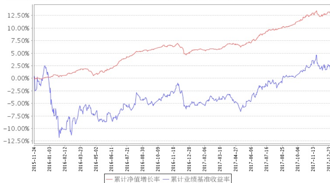
安信新动力混合A累计净值增长率与同期业绩比较基准收益率的历史走势对比图