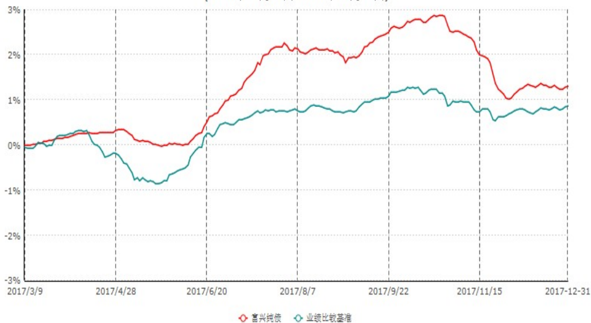
富荣富兴纯债债券型证券投资基金累计净值增长率与业绩比较基准收益率历史走势对比图 (2017年03月09日-2017年12月31日)

注：①本基金基金合同于2017年3月9日生效，截止2017年12月31日止，本基金成立未 满一年；