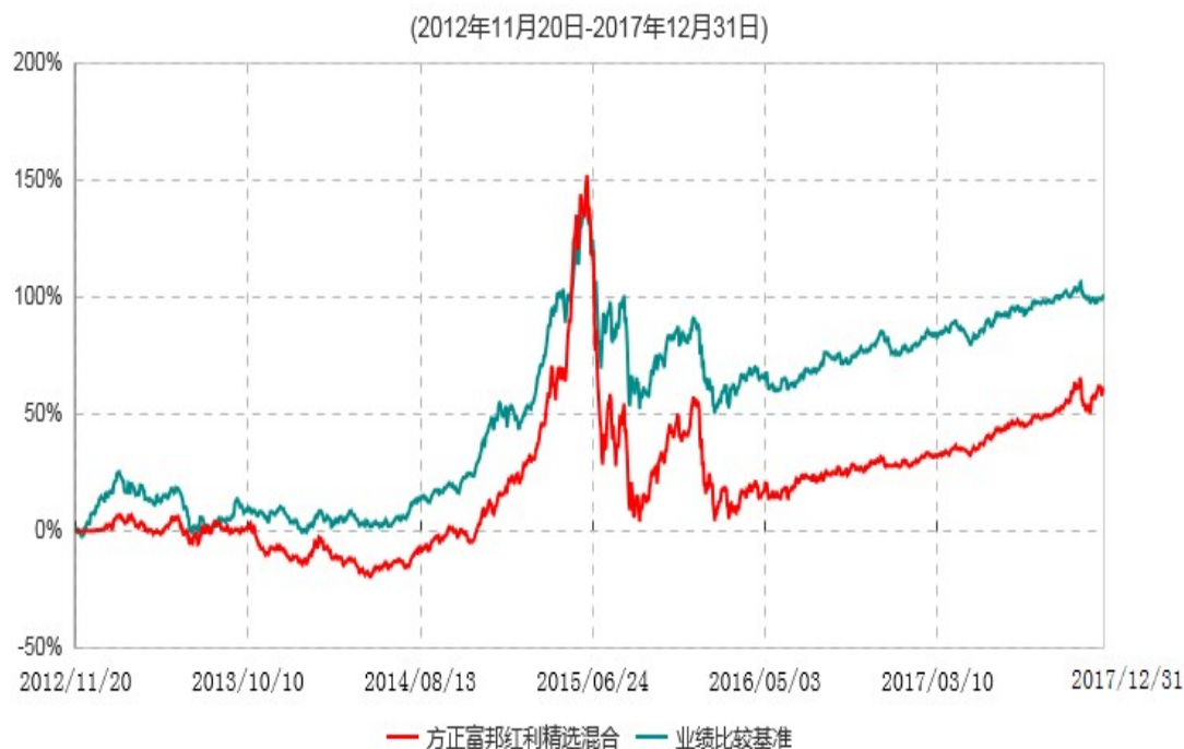
方正富邦红利精选混合型证券投资基金累计净值增长率与业绩比较基准收益率历史走势对比图