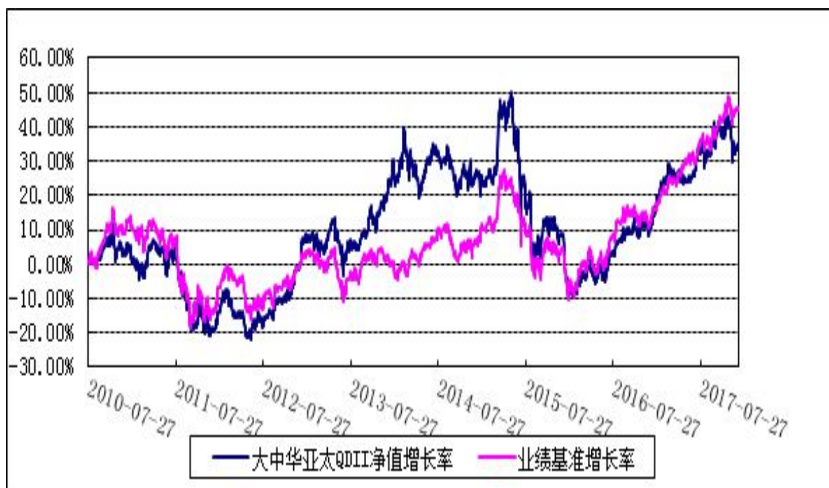
博时大中华亚太精选股票证券投资基金 份额累计净值增长率与业绩比较基准收益率历史走势对比图 (2010 年 7 月 27 日至 2017 年 12 月 31 日)