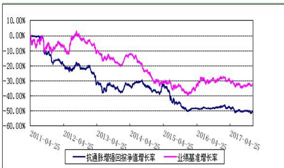
博时抗通胀增强回报证券投资基金 份额累计净值增长率与业绩比较基准收益率历史走势对比图 (2011 年 4 月 25 日至 2017 年 12 月 31 日)

注：本基金的基金合同于 2011 年 4 月 25 日生效，按照本基金的基金合同规定，自基金合同生效之日起六个月内使基金的投资组合比例符合本基金合同第 14 条“二、投资范围”、“八、投资限制”的有关约定。本基金建仓期结束时各项资产配置比例符合基金合同约定。