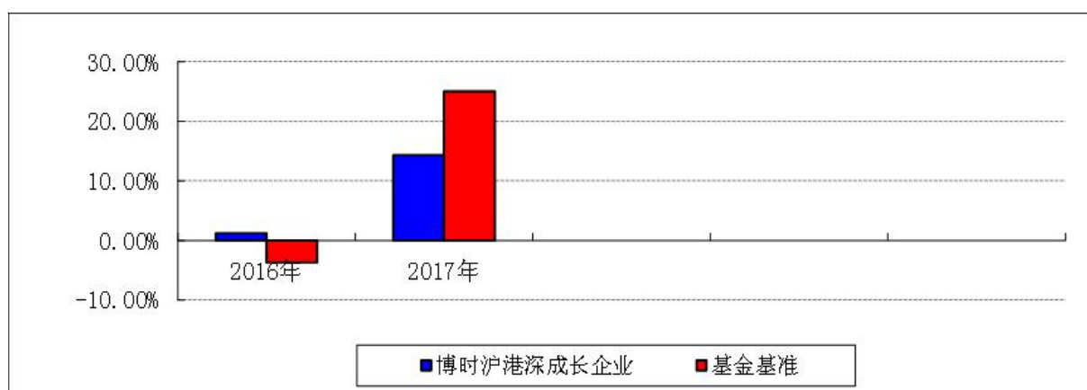
自基金合同生效以来基金净值增长率与业绩比较基准收益率的对比图

注：本基金的基金合同于 2016 年 11 月 2 日生效。合同生效当年按实际存续期计算，不按整个自然年度进行折算。