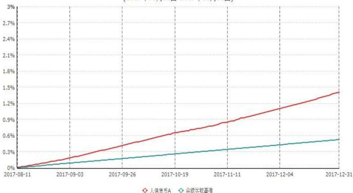
人保货币A累计净值收益率与业绩比较基准收益率历史走势对比图 (2017年08月11日-2017年12月31日)