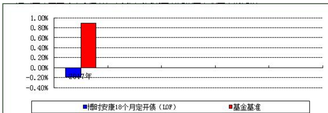
自基金合同生效以来基金净值增长率与业绩比较基准收益率的对比图

注：本基金合同于 2017 年 2 月 17 日生效，合同生效当年按实际存续期计算，不按整个自然年度进行折算。