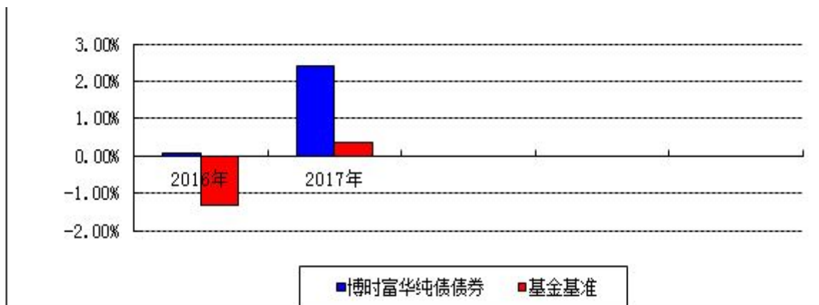
自基金合同生效以来基金净值增长率与业绩比较基准收益率的对比图

注：本基金合同于 2016 年 11 月 25 日生效，合同生效当年按实际存续期计算，不按整个自然年度进行折算。