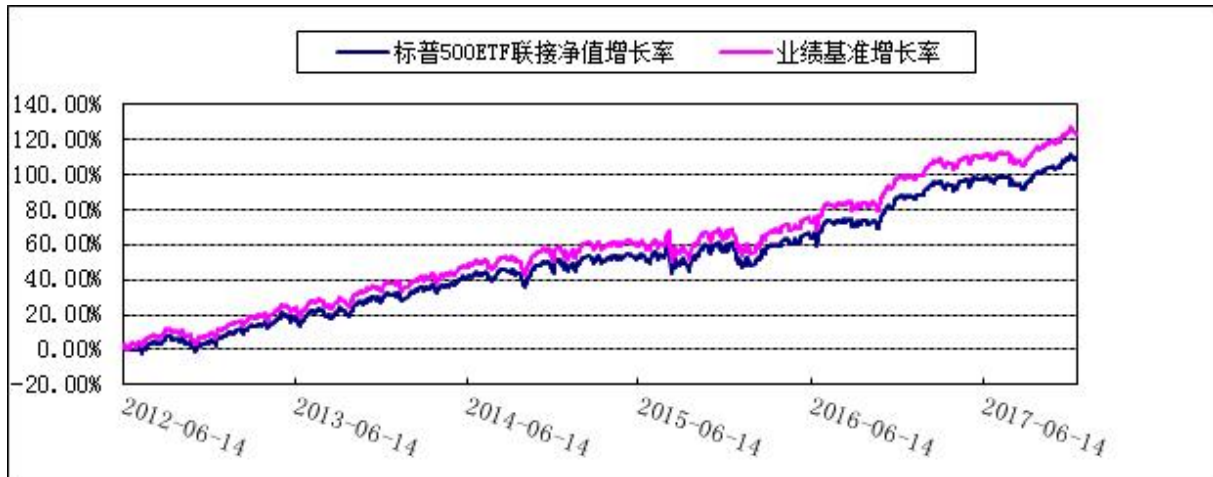
博时标普 500 交易型开放式指数证券投资基金联接基金 自基金合同生效以来份额累计净值增长率与业绩比较基准收益率历史走势对比图 (2012 年 6 月 14 日至 2017 年 12 月 31 日)