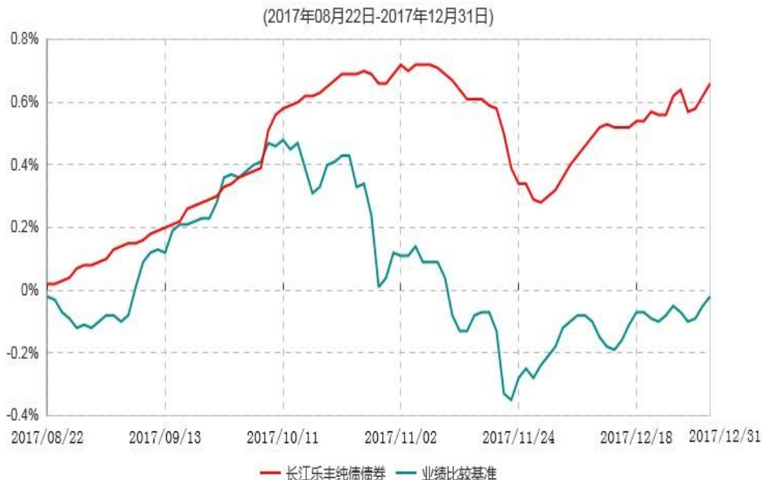
长江乐丰纯债定期开放债券型发起式证券投资基金累计净值增长率与业绩比较基准收益率历史走势对比图

注：（1）本基金基金合同生效日为2017年8月22日，截至本报告期末未满一年；（2）按照本基金的基金合同规定，自基金合同生效之日起6个月内使基金的投资组合比例符合基金合同第十二部分“（二）投资范围”、“（四）投资限制”的有关约定；（3）截至本报告期末，本基金尚处在建仓期。