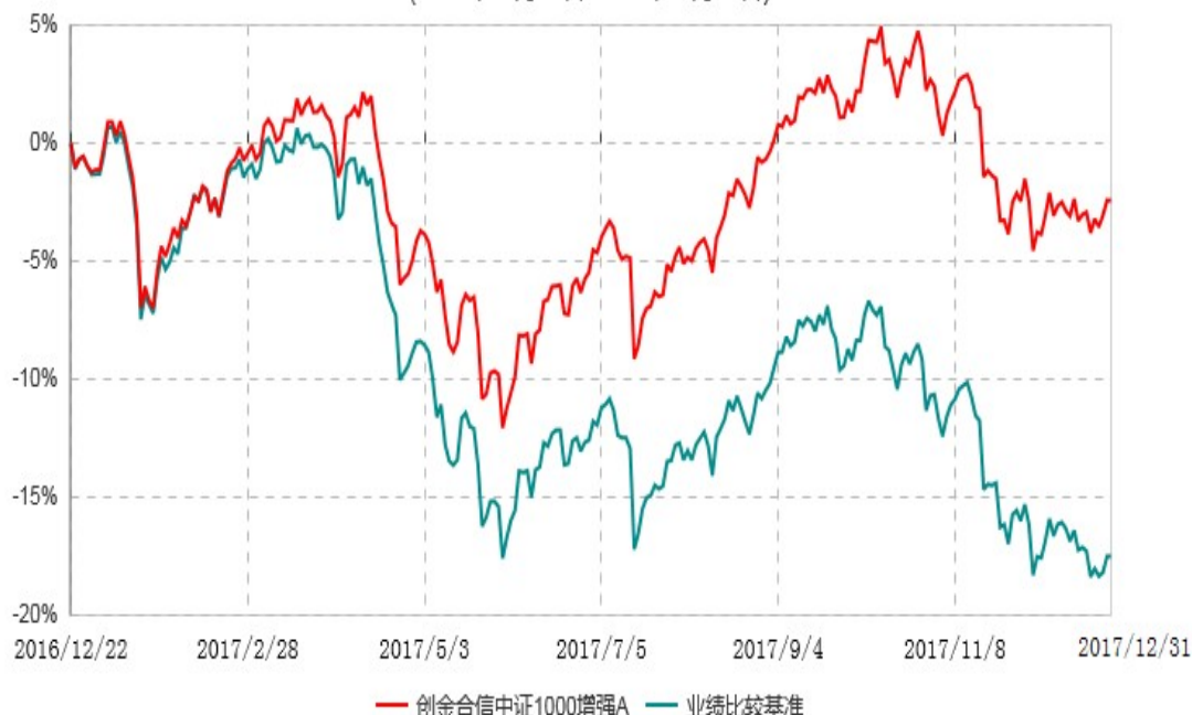
创金合信中证1000增强C累计净值增长率与业绩比较基准收益率历史走势对比图