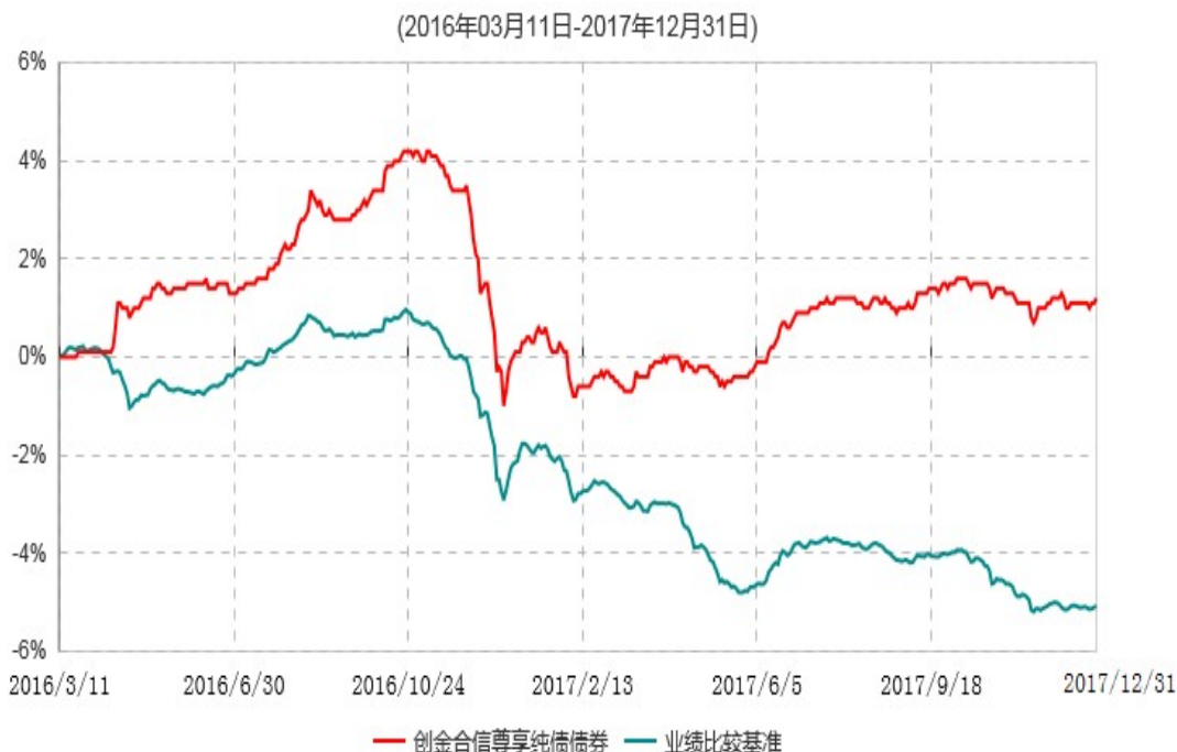
创金合信尊享纯债债券型证券投资基金累计净值增长率与业绩比较基准收益率历史走势对比图