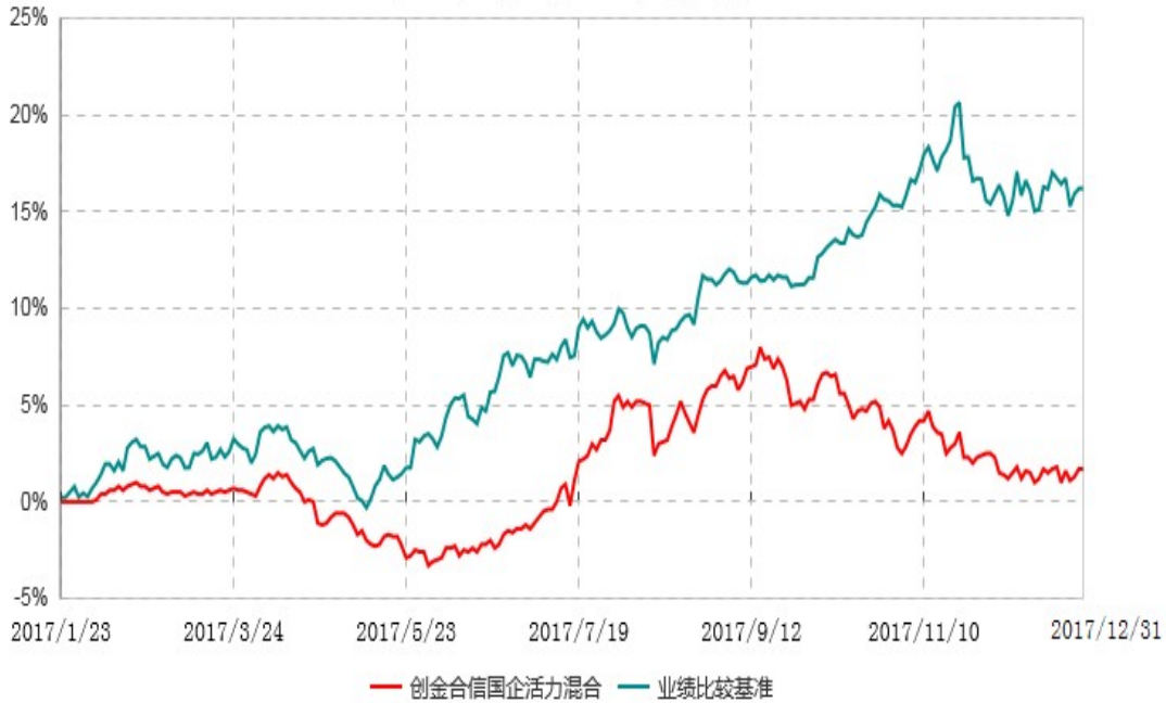
创金合信国企活力混合型证券投资基金累计净值增长率与业绩比较基准收益率历史走势对比图 (2017年01月23日-2017年12月31日)