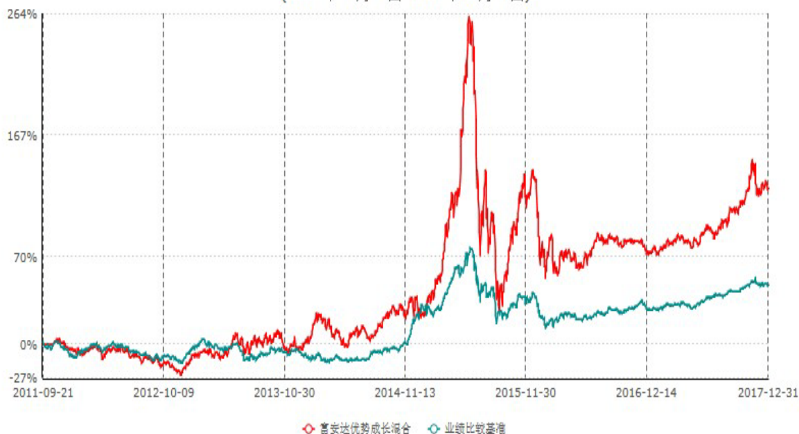
富安达优势成长混合型证券投资基金累计净值增长率与业绩比较基准收益率历史走势对比图 (2011年09月21日-2017年12月31日)

本基金于2011年9月21日成立，根据《富安达优势成长混合型证券投资基金基金合同》规定，本基金建仓期为6个月，建仓截止日为2012年3月20日。建仓期结束时本基金各项资产配置比例符合本基金合同规定的比例限制及投资组合的比例范围。