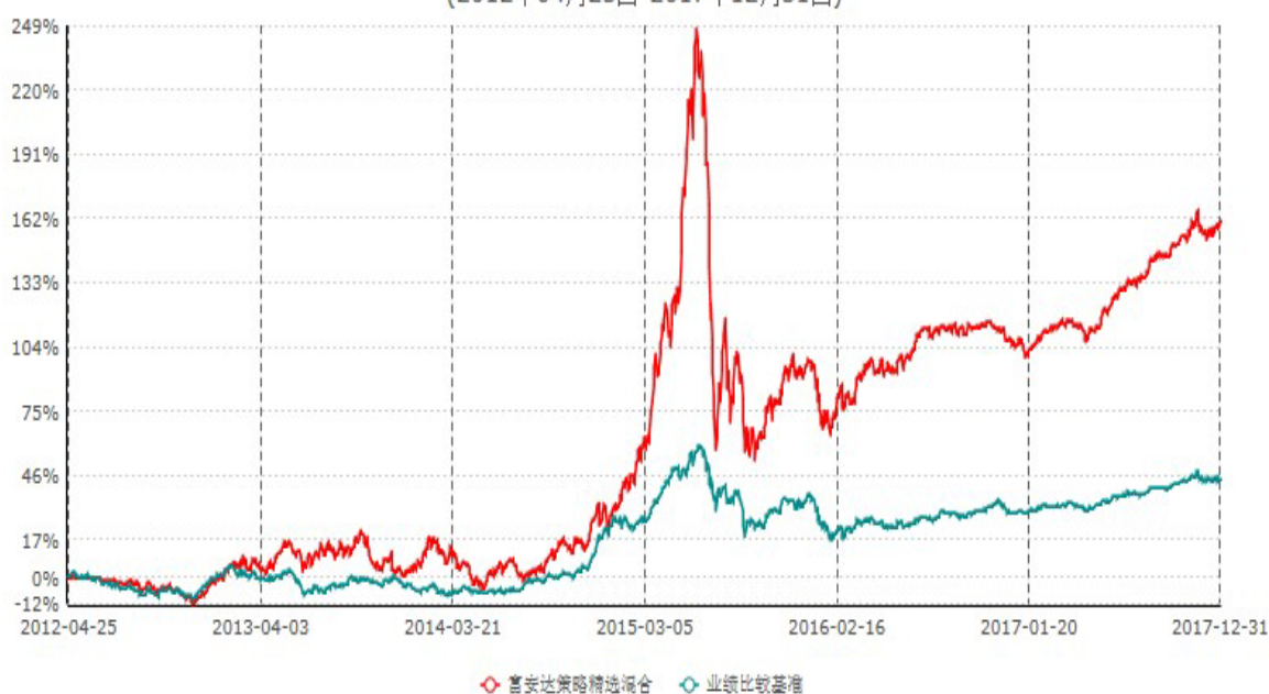
富安达策略精选灵活配置混合型证券投资基金累计净值增长率与业绩比较基准收益率历史走势对比图 (2012年04月25日-2017年12月31日)

本基金于2012年4月25日成立，根据《富安达策略精选灵活配置混合型证券投资基金合同》规定，本基金建仓期为6个月，建仓截止日为2012年10月24日。建仓期结束时本基金各项资产配置比例符合本基金合同规定的比例限制及投资组合的比例范围。