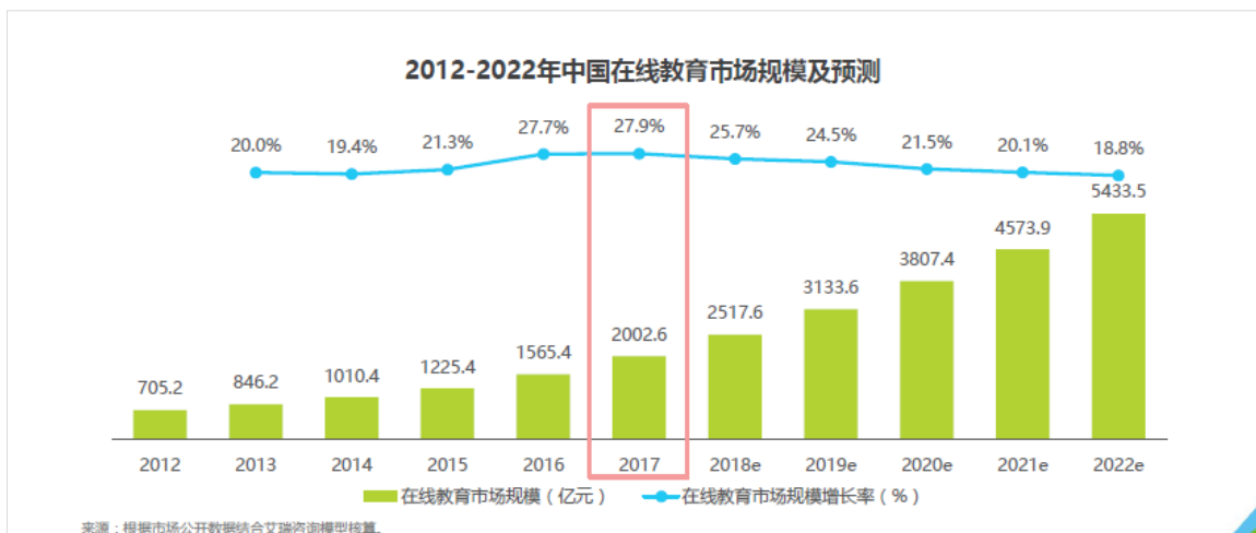
在线教育市场规模图表