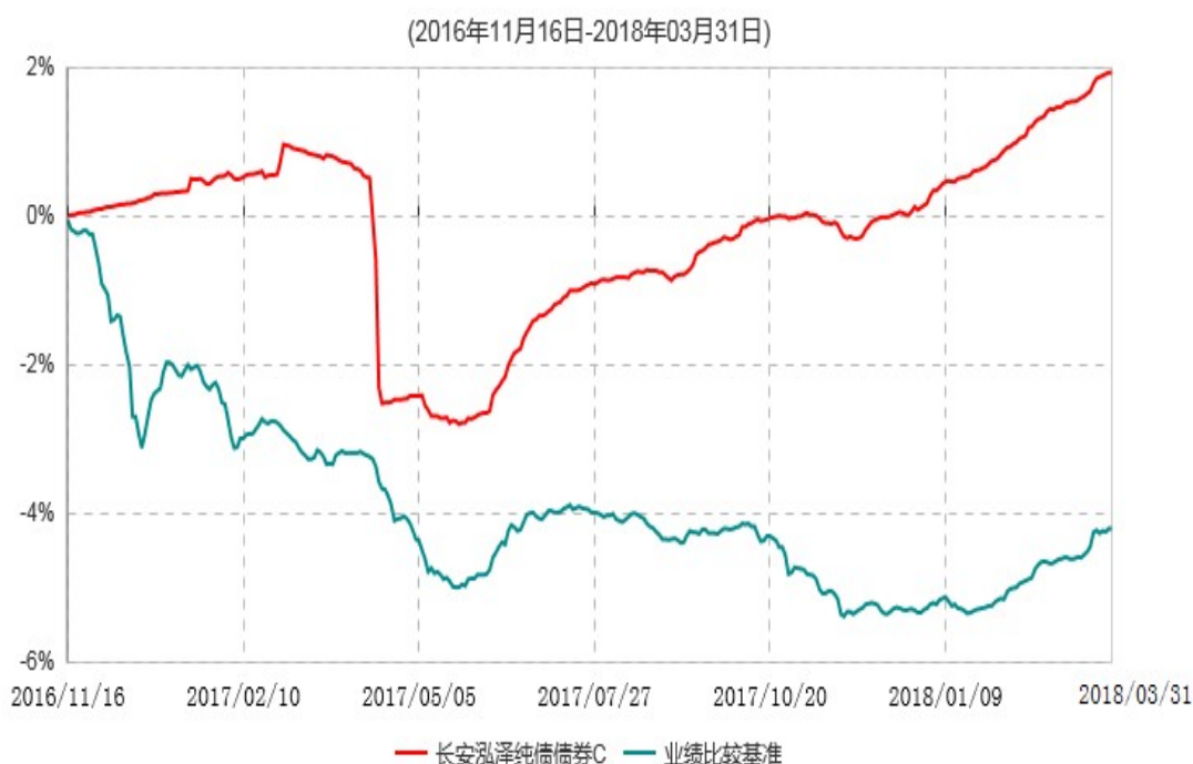
长安泓泽纯债债券C累计净值增长率与业绩比较基准收益率历史走势对比图

本基金基金合同生效日为 2016 年 11 月 16 日，按基金合同规定，本基金自基金合同生效起 6 个月为建仓期，截止到建仓期结束时，本基金的各项投资组合比例已符合基金合同的相关规定。基金合同生效日至报告期期末，本基金运作时间已满一年，图示日期为 2016 年 11 月 16 日至 2018 年 3 月 31 日。