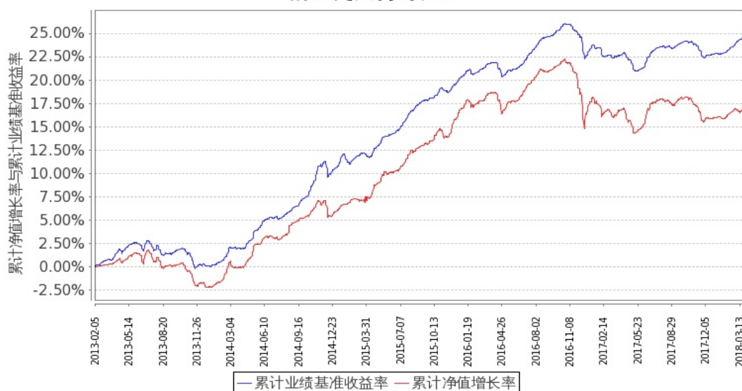
图1：嘉实中证中期企业债指数 (LOF) A 基金份额累计净值增长率与同期业绩比较基准收益率的历史走势对比图