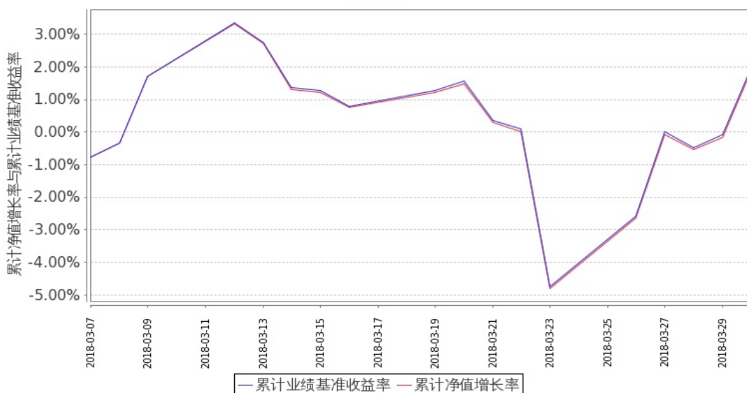
图 2: 嘉实中创 400ETF 联接 C 基金份额累计净值增长率与同期业绩比较基准收益率的历史走势对比图