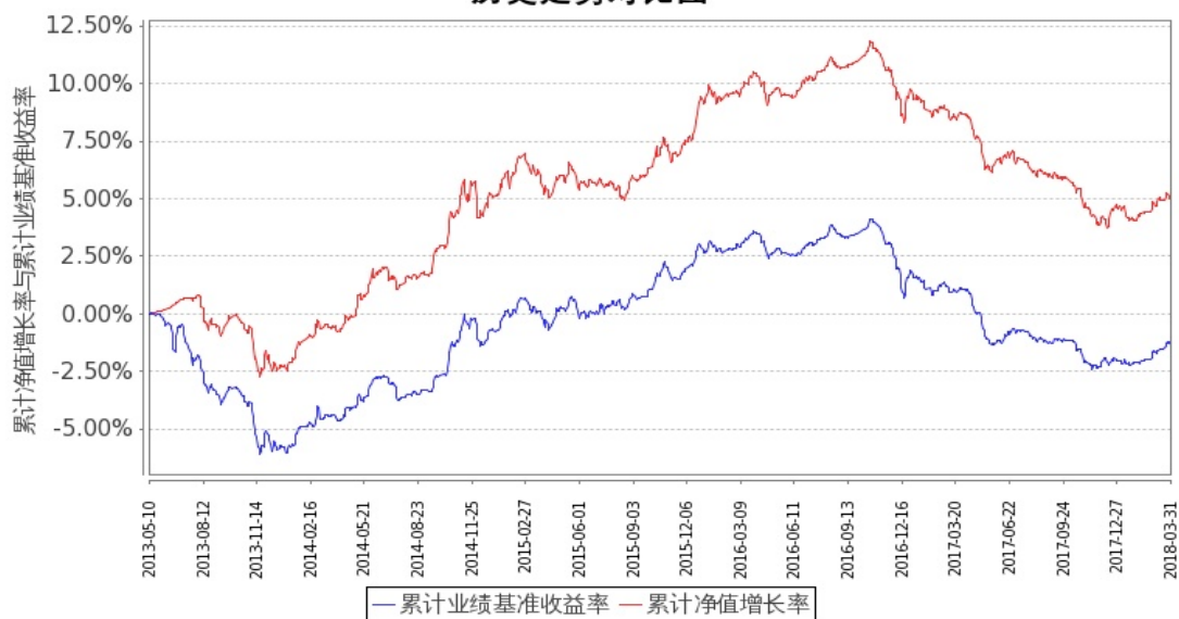
图 1：嘉实中证金边中期国债 ETF 联接 A 基金份额累计净值增长率与同期业绩比较基准收益率的历史走势对比图 (2013 年 5 月 10 日至 2018 年 3 月 31 日)