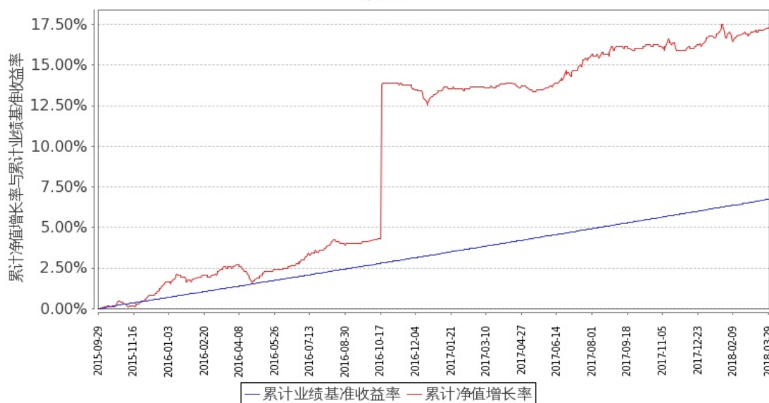
图 2：嘉实丰益信用定期债券 C 基金份额累计净值增长率与同期业绩比较基准收益率的历史走势对比图