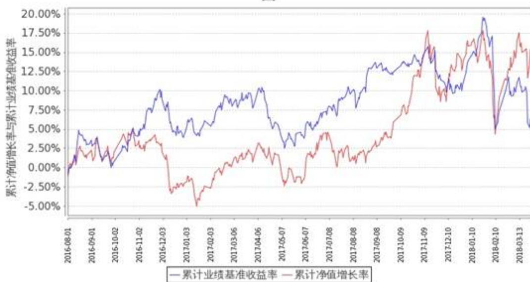
图 2：嘉实成长收益混合 H 基金份额累计净值增长率与同期业绩比较基准收益率的历史走势对比图（2016 年 8 月 1 日至 2018 年 3 月 31 日）

注：按基金合同规定，本基金自基金合同生效日起 6 个月内为建仓期。建仓期结束时本基金的各项投资比例符合基金合同第十八条（二）投资范围和（六）投资组合比例限制）的约定：