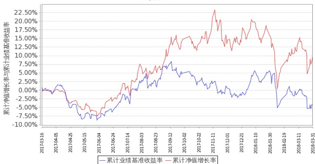
图 1：嘉实新能源新材料股票 A 基金累计份额净值增长率与同期业绩比较基准收益率的历史走势对比图