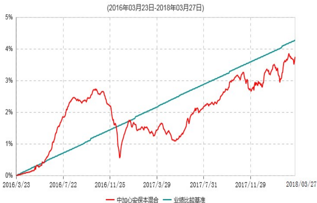
中加心安保本混合型证券投资基金累计净值增长率与业绩比较基准收益率历史走势对比图

注：根据基金合同的约定，本基金建仓期为6个月。建仓期结束时，本基金的各项投资比例符合基金合同关于投资范围及投资限制规定。