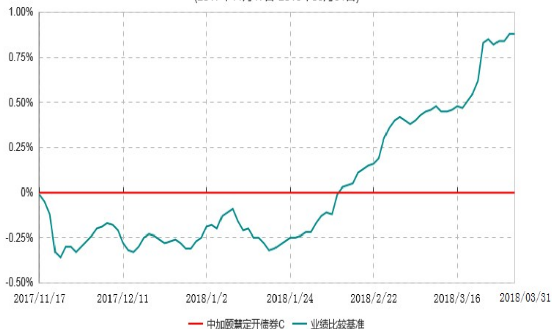
中加颐慧定开债券C累计净值增长率与业绩比较基准收益率历史走势对比图 (2017年11月17日-2018年03月31日)