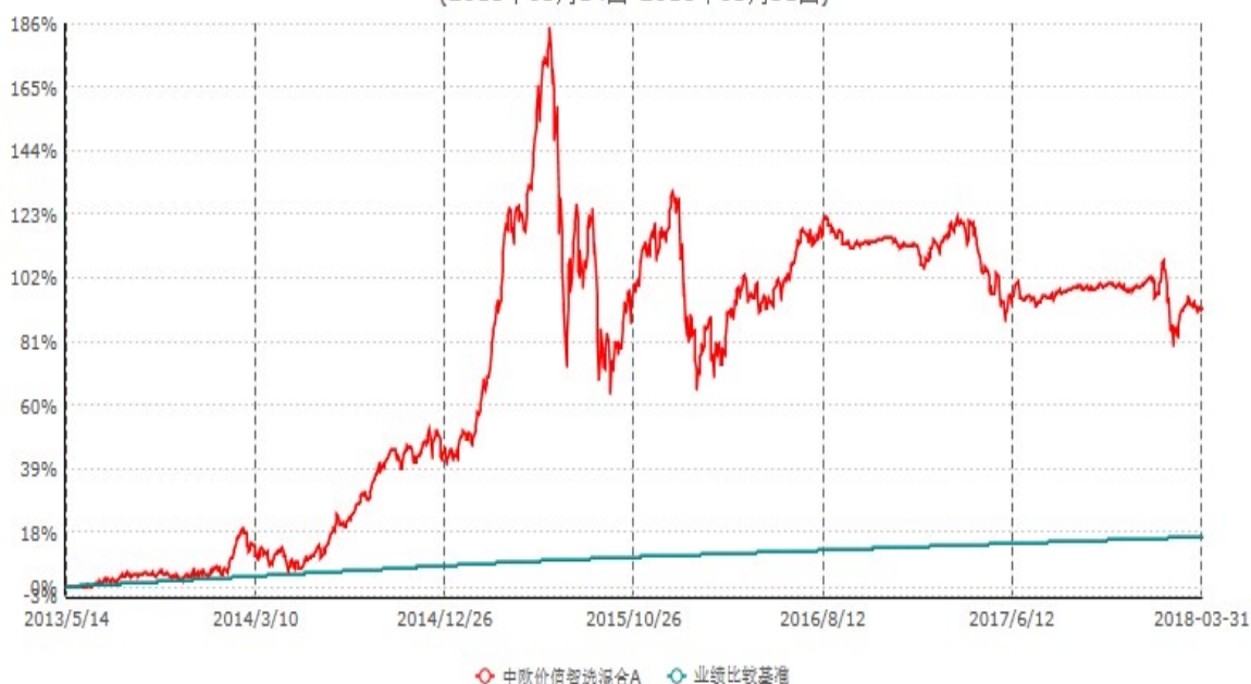
中欧价值智选混合A累计净值增长率与业绩比较基准收益率历史走势对比图 (2013年05月14日-2018年03月31日)