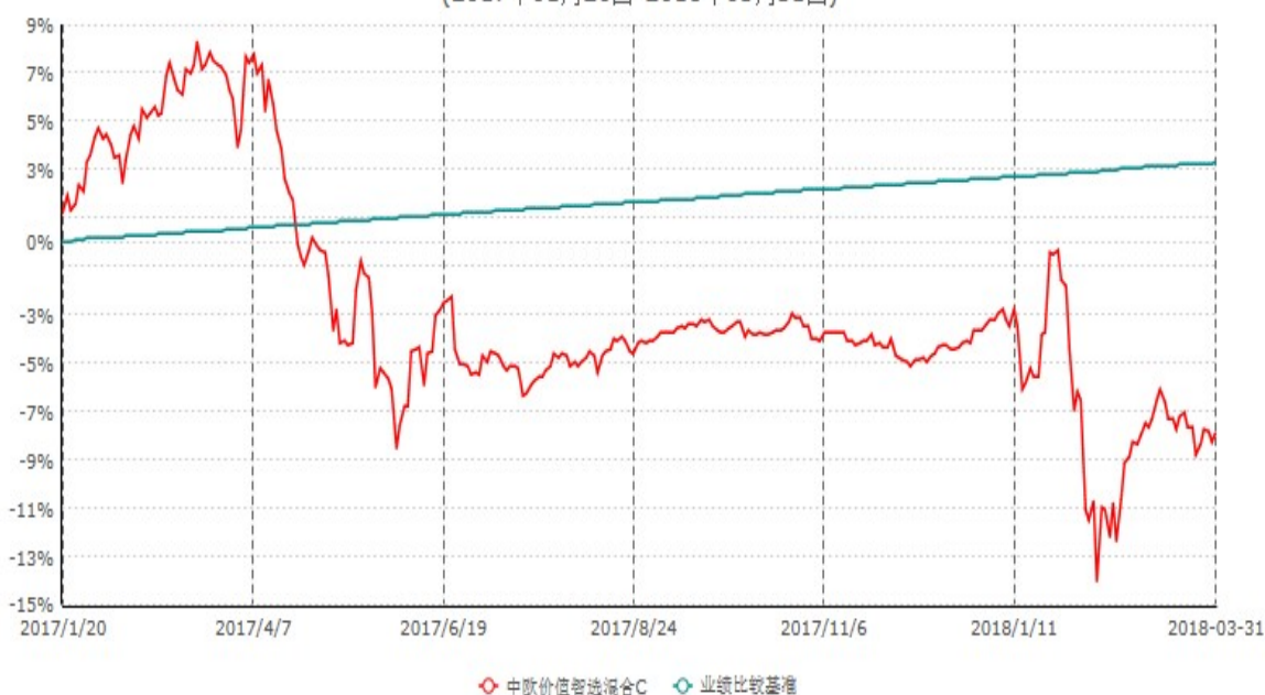
中欧价值智选混合C累计净值增长率与业绩比较基准收益率历史走势对比图 (2017年01月20日-2018年03月31日)

注：本基金自 2017 年 1 月 19 日起增加 C 份额，图示为 2017 年 1 月 20 日至 2018 年 03 月 31 日。