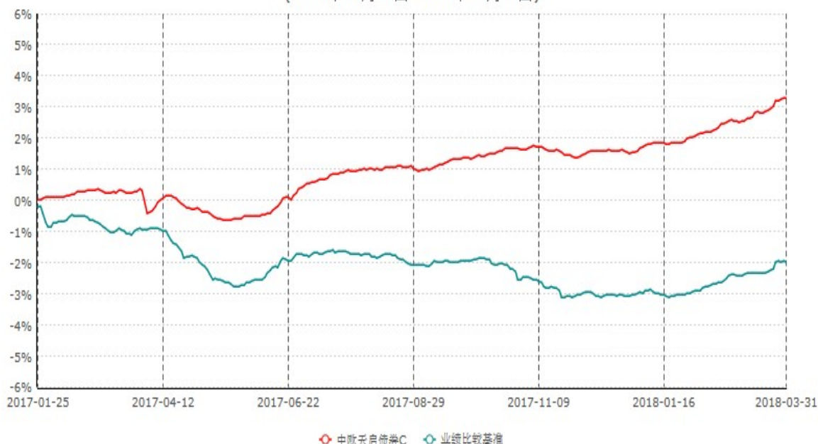
中欧天启债券C累计净值增长率与业绩比较基准收益率历史走势对比图 (2017年01月25日-2018年03月31日)

注：本基金基金合同生效日期为 2017 年 1 月 25 日，按基金合同的规定，本基金自基金合同生效起六个月为建仓期，建仓期结束时各项资产配置比例已达到基金合同约定。