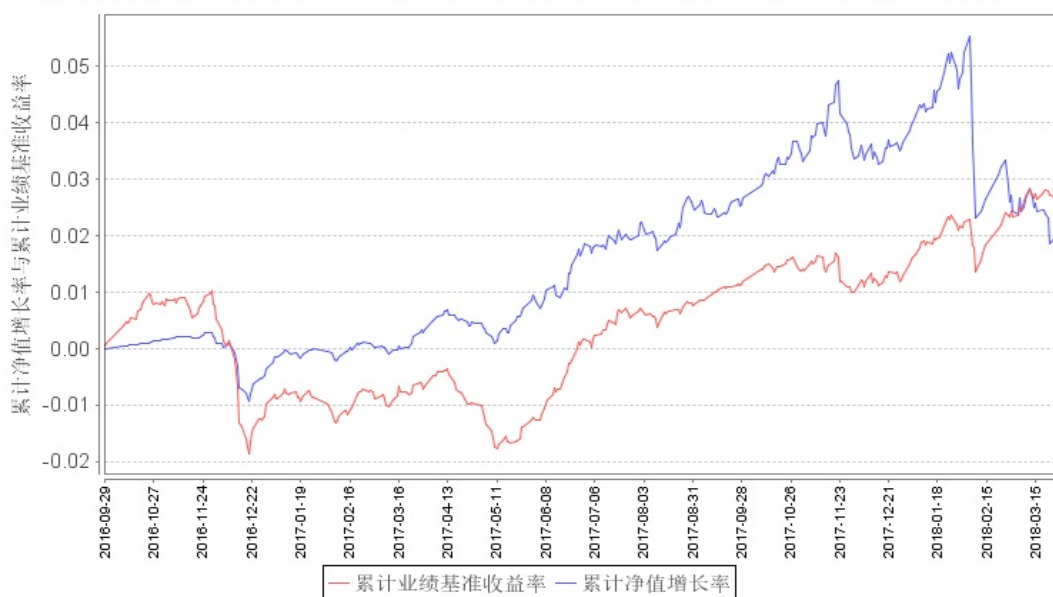
鹏华弘康混合A累计净值增长率与同期业绩比较基准收益率的历史走势对比图