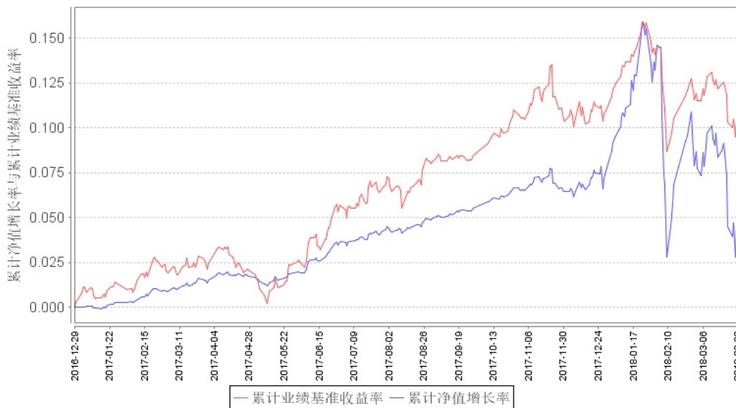
鹏华弘樽混合A类累计净值增长率与同期业绩比较基准收益率的历史走势对比图