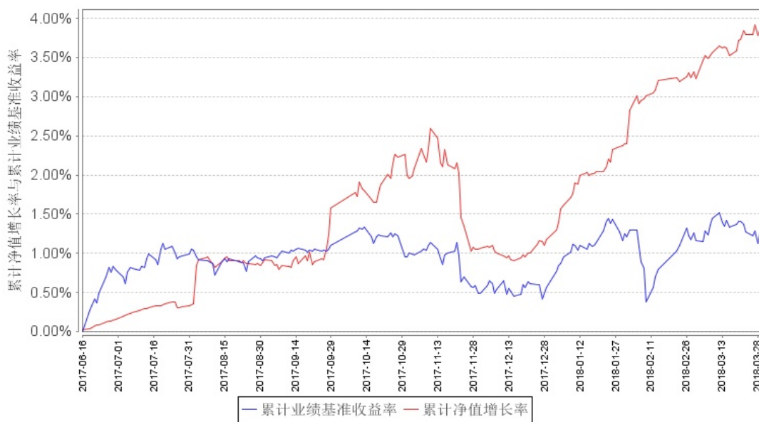
南方高元A累计净值增长率与同期业绩比较基准收益率的历史走势对比图