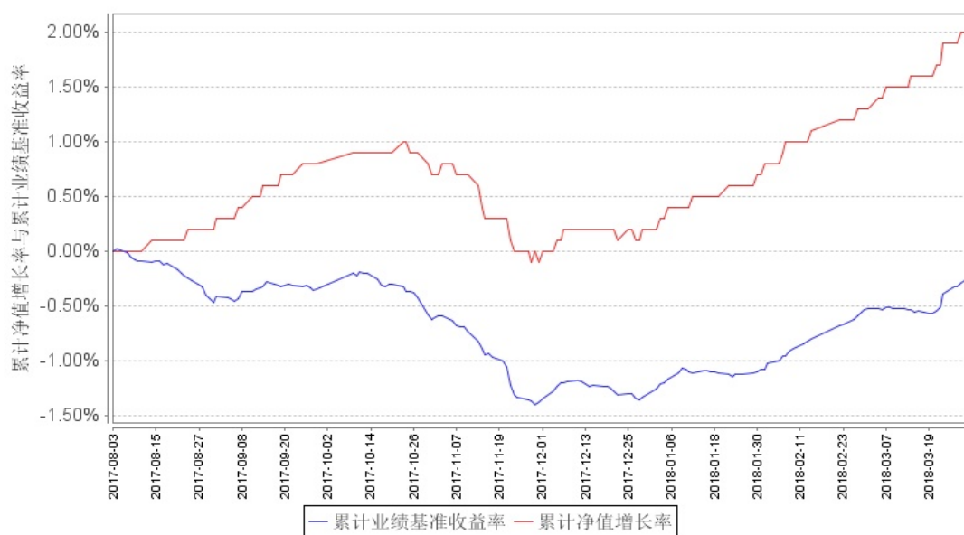
南方祥元A累计净值增长率与同期业绩比较基准收益率的历史走势对比图