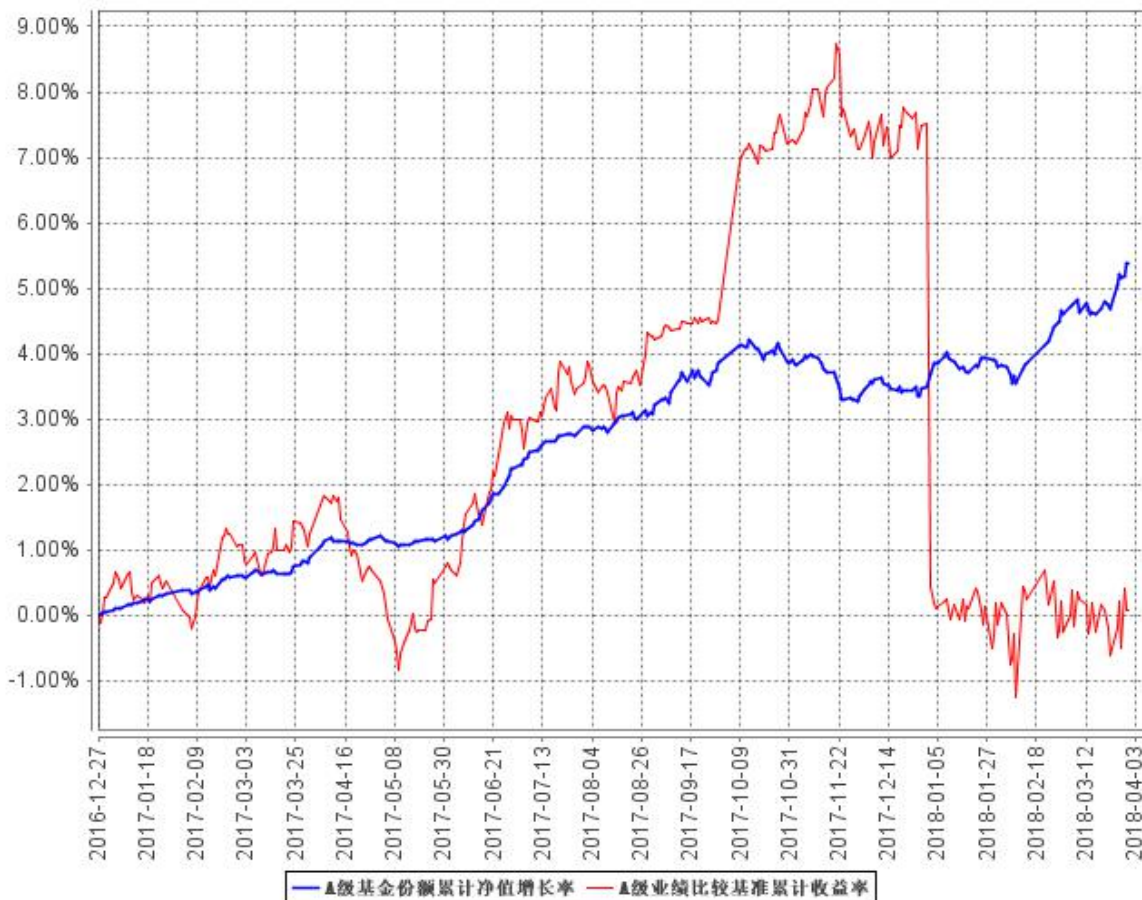
A级基金份额累计净值增长率与同期业绩比较基准收益率的历史走势对比图