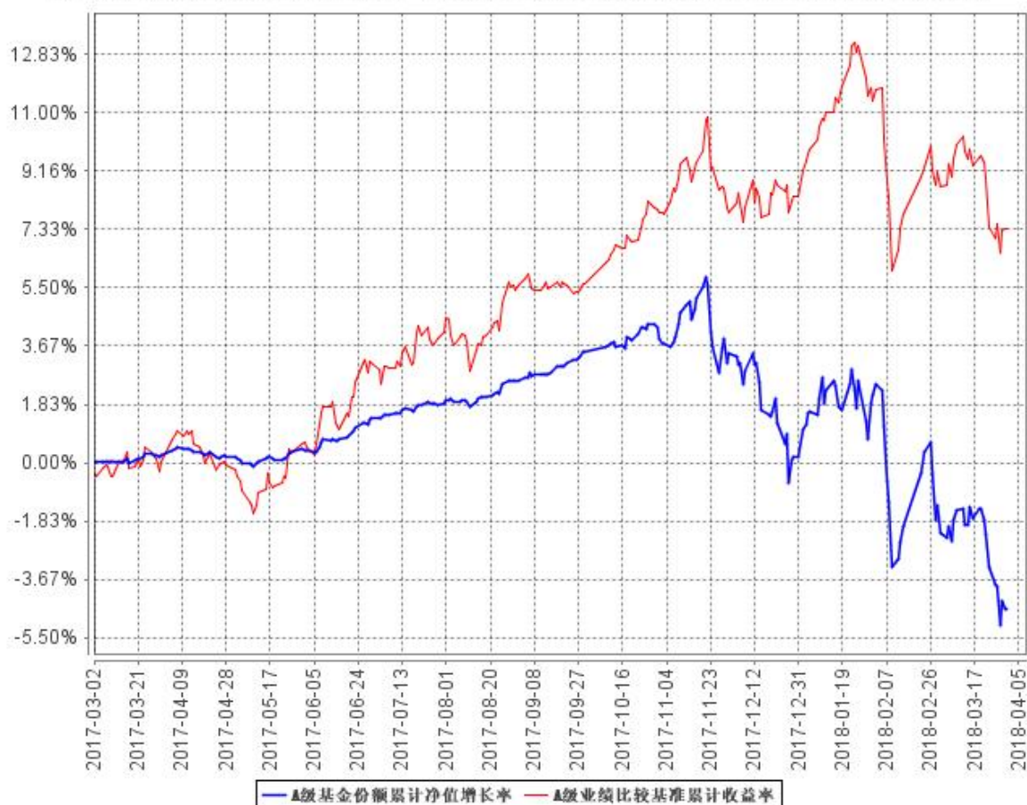
A级基金份额累计净值增长率与同期业绩比较基准收益率的历史走势对比图