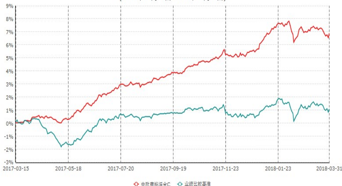
中欧康裕混合C累计净值增长率与业绩比较基准收益率历史走势对比图 (2017年03月15日-2018年03月31日)

注：本基金基金合同生效日期为 2017 年 3 月 15 日，按基金合同的规定，本基金自基金合同生效起六个月为建仓期，建仓期结束时各项资产配置比例已达到基金合同约定。