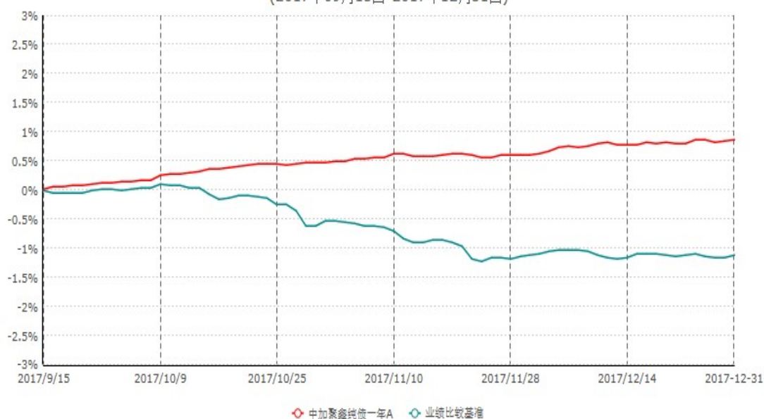
中加聚鑫纯债一年A累计净值增长率与业绩比较基准收益率历史走势对比图 (2017年09月15日-2017年12月31日)

2、自基金合同生效以来基金累计净值增长率变动及其与同期业绩比较基准收益率变动的比较