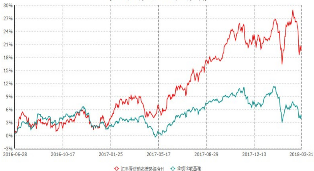
汇丰晋信动态策略混合H累计净值增长率与业绩比较基准收益率历史走势对比图 (2016年06月28日-2018年03月31日)