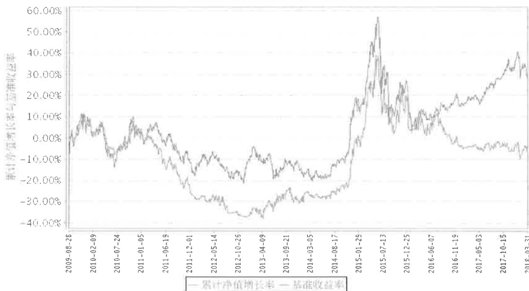
累计净值增长率与同期业绩比较基准收益率的历史走势对比图