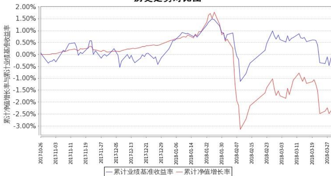
图 1：嘉实领航资产配置混合（FOF）A 基金累计份额净值增长率与同期业绩比较基准收益率的历史走势对比图（2017 年 10 月 26 日至 2018 年 3 月 31 日）