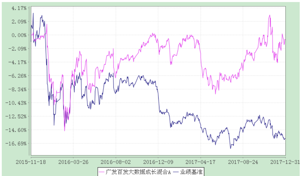
(2) 广发百发大数据成长混合 E: