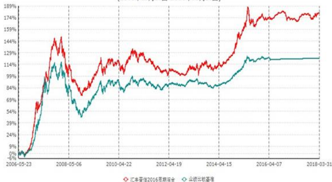
汇丰晋信2016生命周期开放式证券投资基金累计净值增长率与业绩比较基准收益率历史走势对比图 (2006年05月23日-2018年03月31日)