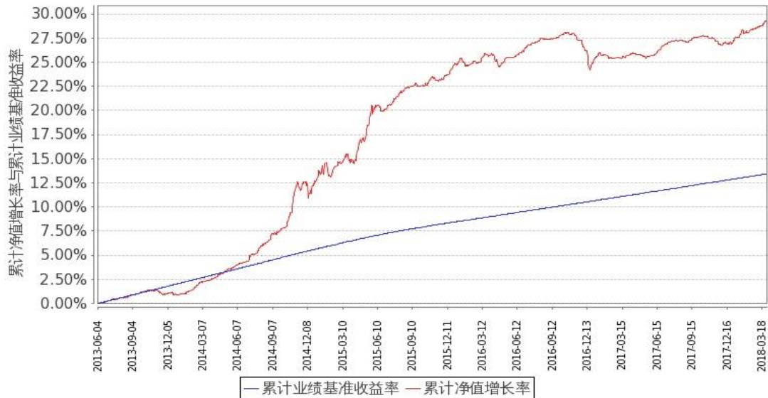
图1：嘉实如意宝定期债券 A/B 基金份额累计净值增长率与同期业绩比较基准收益率的历史走势对比图