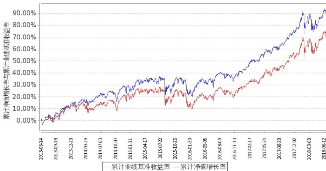
图 2：嘉实美国成长股票型证券投资基金-美元现汇基金份额累计净值增长率与同期业绩比较基准收益率的历史走势对比图