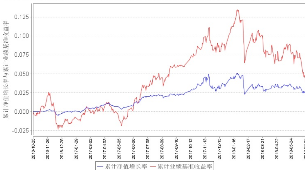
鹏华弘尚混合A类累计净值增长率与同期业绩比较基准收益率的历史走势对比图