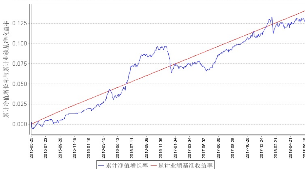
鹏华弘实混合A累计净值增长率与同期业绩比较基准收益率的历史走势对比图