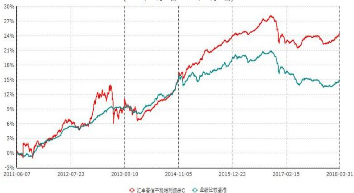
汇丰晋信平稳增利债券C累计净值增长率与业绩比较基准收益率历史走势对比图 (2011年06月07日-2018年03月31日)

注：1. 按照基金合同的约定，本基金主要投资于具有较高息票率的债券品种，包括国债、企业债、公司债、短期融资券、资产支持证券(含资产收益计划)、可转换债券等，投资比例不低于基金资产的 80%，现金或者到期日在一年以内的政府债券不低于基金资产净值的 5%。