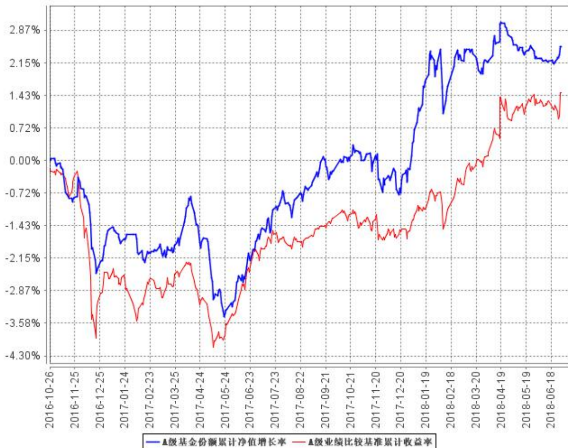
A级基金份额累计净值增长率与同期业绩比较基准收益率的历史走势对比图